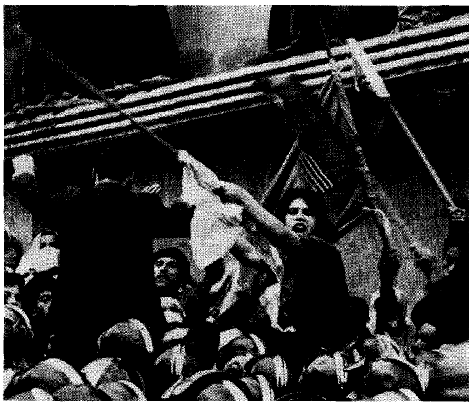
Manifestation à Alger, décembre 1960

A la veille de l'indépendance, les masses algériennes eurent devant elles la possibilité de se débarrasser de leur propre élite féodaliste en même temps qu'elles se débarrassaient de la domination française ; elles auraient pu alors dépasser la lutte pour la démocratie bourgeoise pour s'engager dans la voie de la construction d'une société socialiste. Mais la direction petite-bourgeoise du FLN fit tout ce qui était en son pouvoir pour empêcher une telle issue et assurer les bases du futur capitalisme algérien. A Evian, le FLN s'engagea à coopérer au niveau économique avec l'impérialisme français en échange d'une aide technique et financière. Cet engagement rendait impossible l'accomplissement des tâches simplement démocratiques.